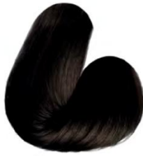
3.0 - CASTANHO ESCURO