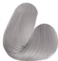
12.11 - BLOND EXTRA CLARO CINZA INTENSO