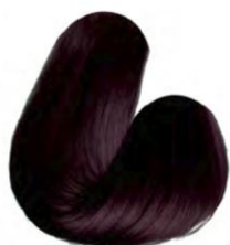
4.65 - CASTANHO MÉDIO VERMELHO ACAJU