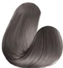
8.1 - LOURO CLARO CINZA