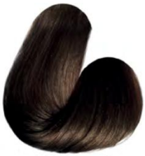
5.3 - CASTANHO CLARO DOURADO