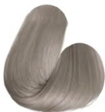
10.1 - LOURO CLARÍSSIMO CINZA