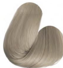
10.89 - LOURO CLARÍSSIMO PÉROLA