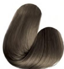
7.31 - LOURO MEDIO MEL