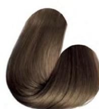
7.7 - LOURO MÉDIO CHOCOLATE