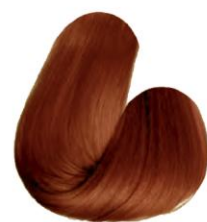
8.44 - LOURO CLARO COBRE INTENSO