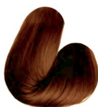
7.4 - LOURO MÉDIO ACOBREADO