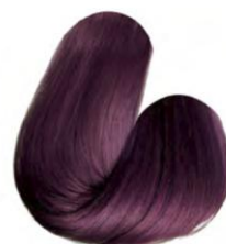
66.26 - MARSALA