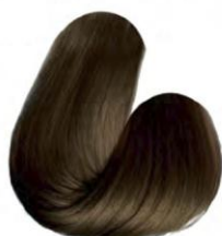
6.7 - LOURO ESCURO CHOCOLATE