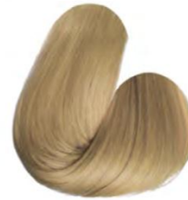
9.0 - LOURO ULTRA CLARO