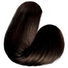
5.0 - CASTANHO CLARO