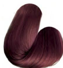
6.66 - LOURO ESCURO VERMELHO INTENSO