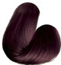
6.65 - CEREJA