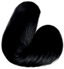
1.0 - PRETO AZULADO