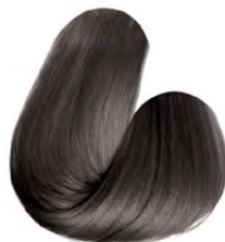
7.1 - LOURO MÉDIO CINZA