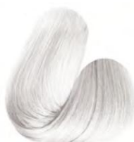
OSP - REFORÇADOR DE CLAREAMENTO