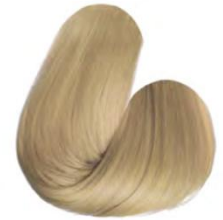
10.0 - LOURO CLARÍSSIMO