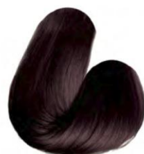
5.66 - CASTANHO CLARO VERMELHO INTENSO