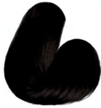
2.0 - PRETO NATURAL