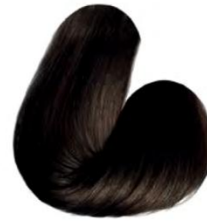
4.0 - CASTANHO MÉDIO