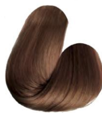
7.34 - LOURO MÉDIO DOURADO COBRE