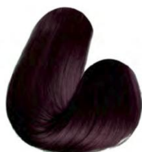
5.65 - AMEIXA