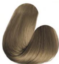
8.31 - LOURO CLARO MEL