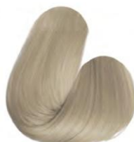
12.89 - BLOND EXTRA CLARO PÉROLA