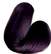
5.20 - CASTANHO CLARO VIOLINE