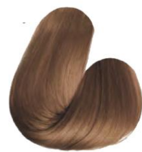
9.34 - LOURO ULTRACLARO DOURADO COBRE