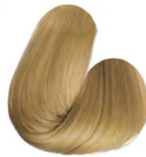
9.3 - LOURO ULTRA CLARO DOURADO