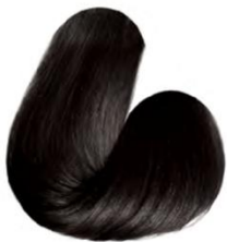
5.1 - CASTANHO CLARO CINZA