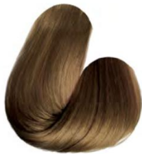
7.3 - LOURO MÉDIO DOURADO