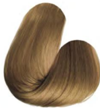
8.3 - LOURO CLARO DOURADO