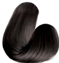
6.1 - LOURO ESCURO CINZA