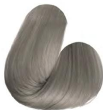
9.1 - LOURO ULTRA CLARO CINZA