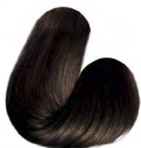
5.7 - CASTANHO CLARO MARROM